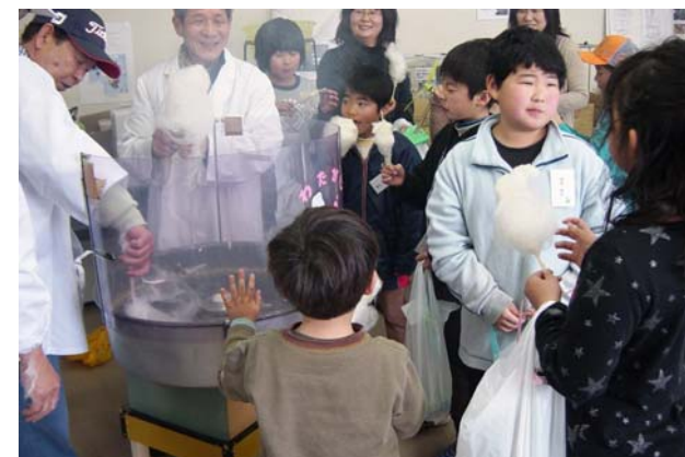
綿飴のできる原理は？ 楽しい実験