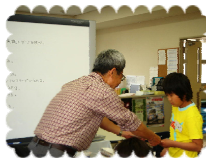
モノづくり賞表彰