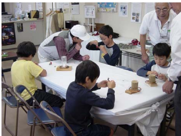
電磁コイル巻線風景