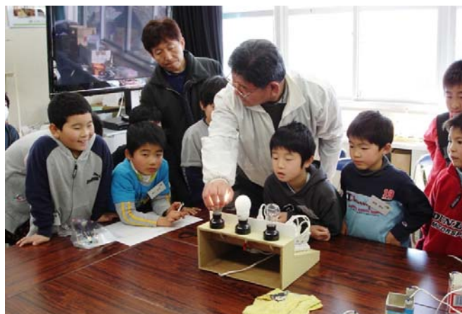
省エネを電灯で実験