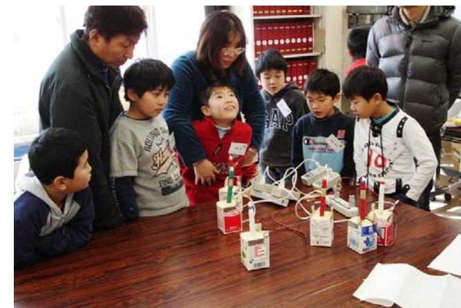
電気パンづくりで科学のおもしろさを体験