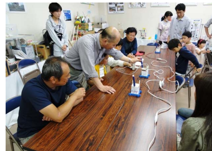
電気パンづくりで科学の楽しさ体験