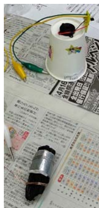
備長炭電池でオルゴールを鳴らす