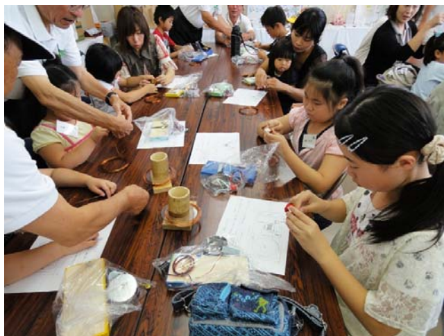
電磁コイル巻線風景

電磁石を応用したベル（電鈴）づくり。全員が上手にベルをつくり、自分で作ったベルの音に歓声！ ベルの鳴る原理を理解してもらい、モノづくりの楽しさを体験してもらった。