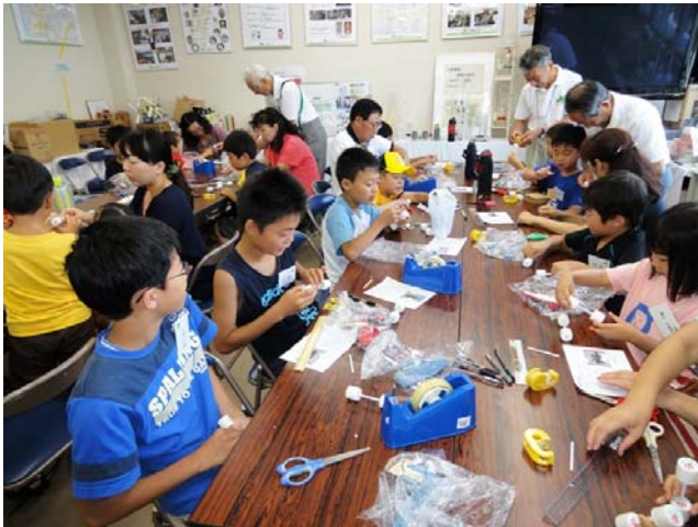
車体組み立て風景