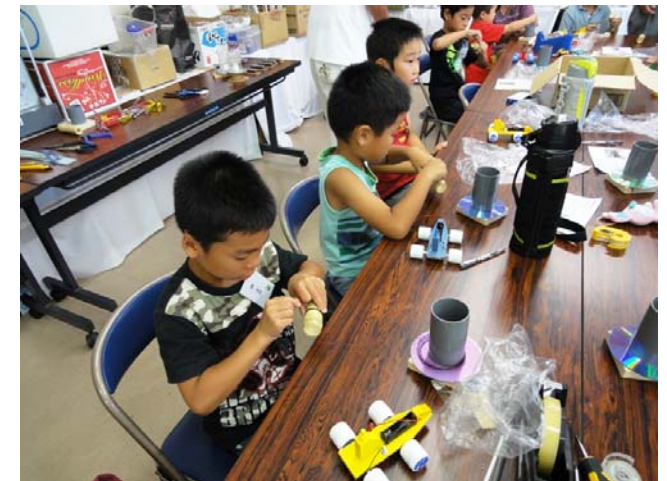
治具を使って巻き線作業