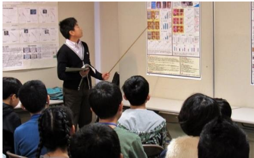
光の種類と有色雑音が植物育成に与える有効性