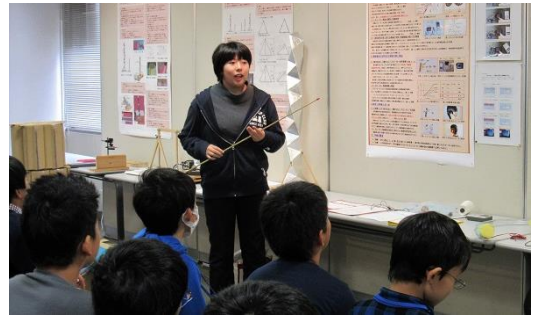
音の出ない(漏れない)スピーカー