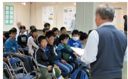
瀧澤代表による講評