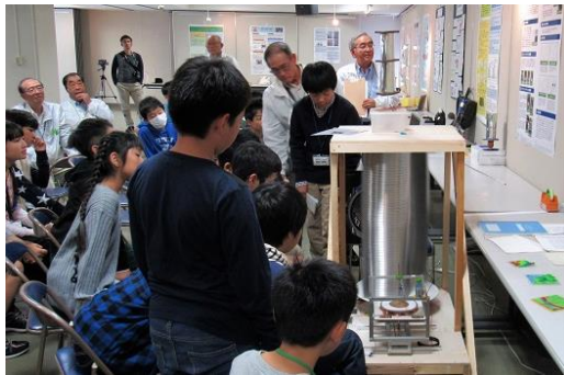
身近な材料で電気・熱を作ってみよう