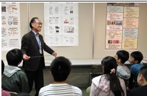
青春の一ひとコマ(K講師)