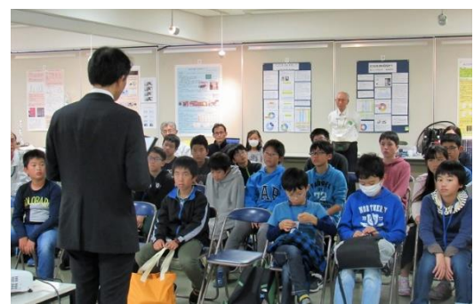
市教委正木先生による講評