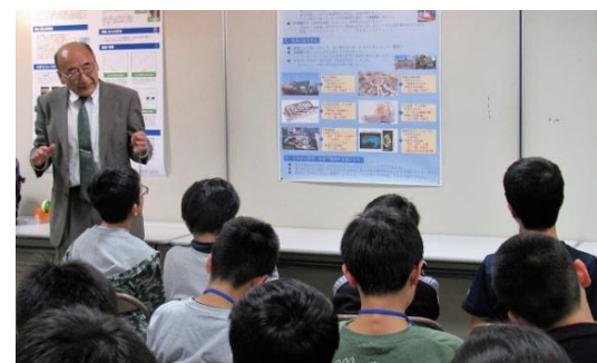
なぜか「放射線なんでも屋」になりました(H講師)