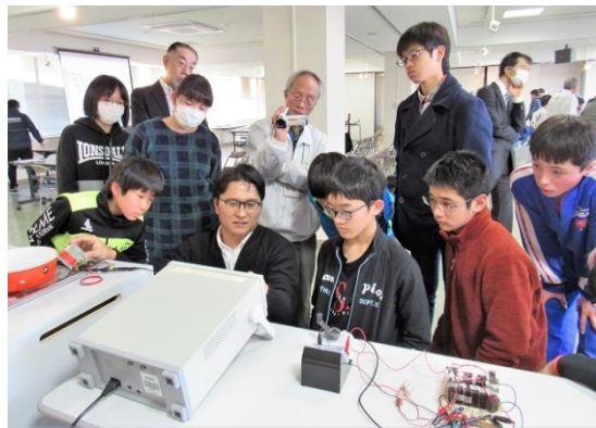
8万Hzの交流でアルミ鍋も加熱する