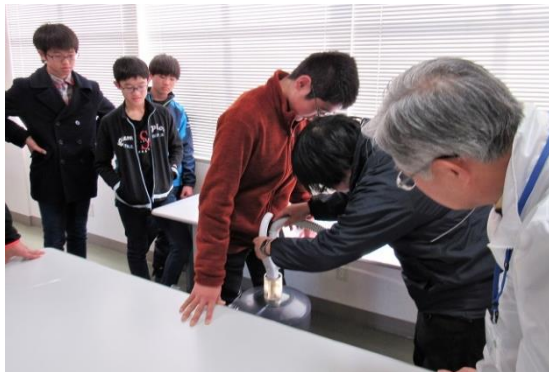
真空掃除機はすごい力持ち