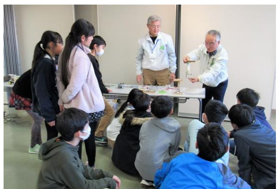
駆動モーターの原理