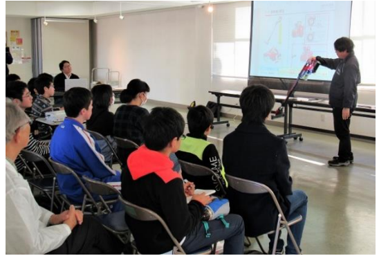
日立サイクロン掃除機の紹介