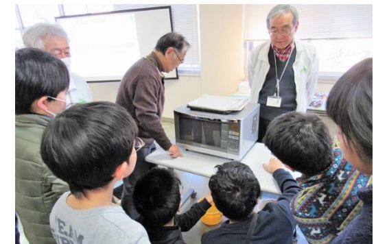
ネオン管で電磁波の動きを見る