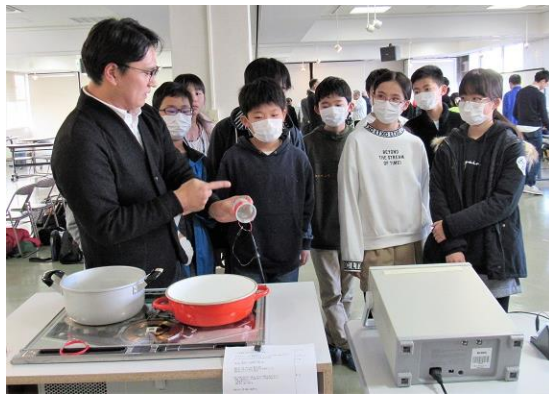
IHクッキングヒーターの誘導電流を見る