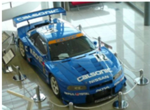
ロビーの展示品