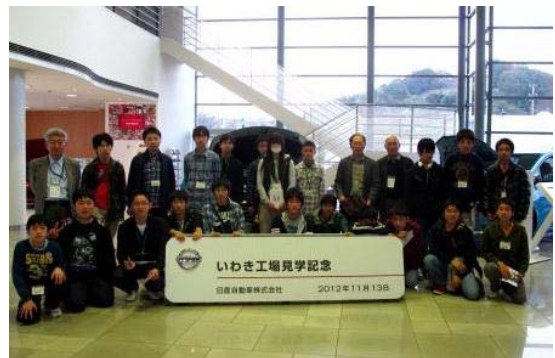
ロビーで記念撮影