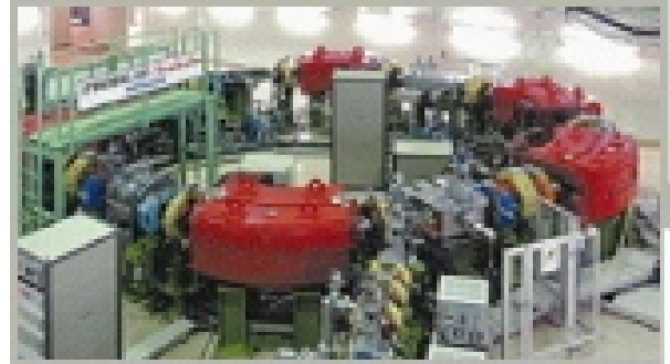
粒子線ガン治療の説明(日研HPより)