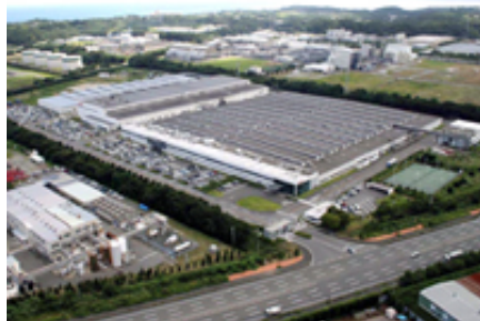
エンジン工場の全景