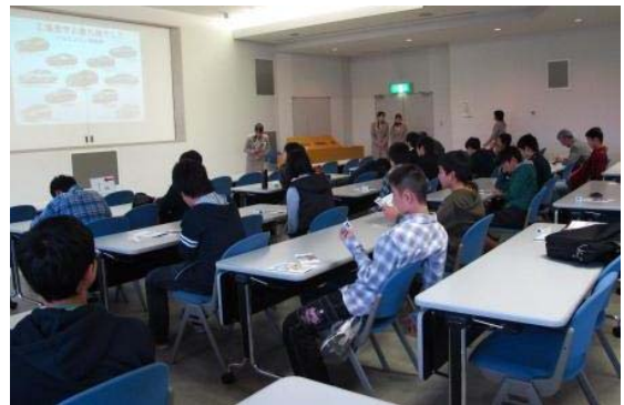
見学前の概要説明