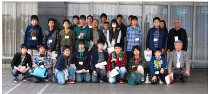
玄関前で記念撮影