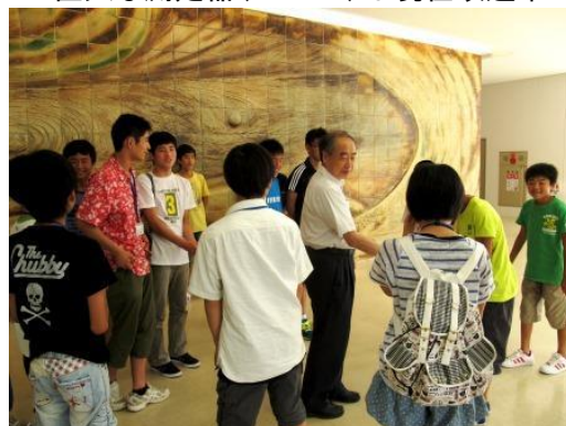
ノーベル賞受賞者と握手して一同感激