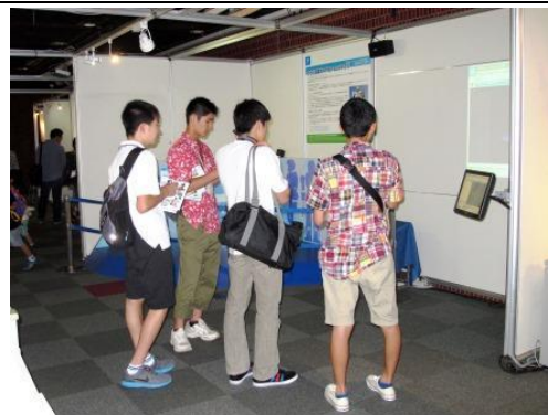
チョロメテってどんなロボット?