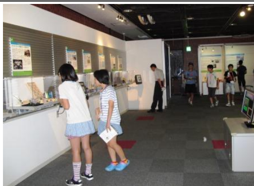
サイエンススクエアで新技術の展示を見る