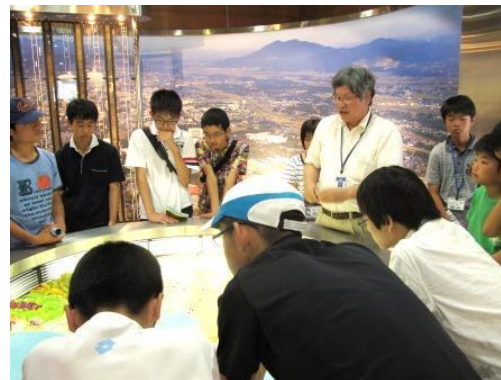
太平洋の海底はどうなっているのかな?