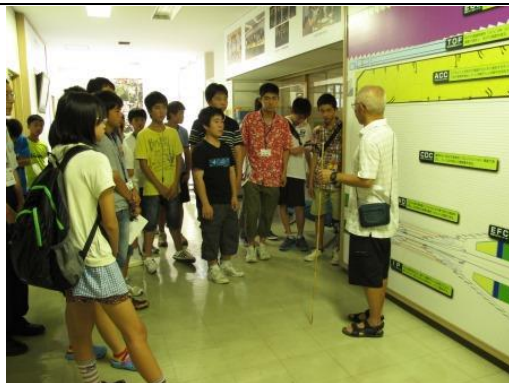
KEKB 加速器の開発経緯を学ぶ