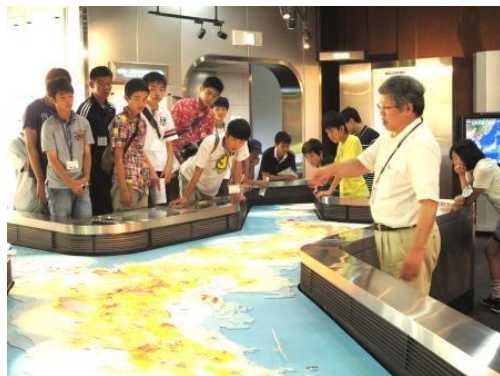
地質標本館で日本列島のなりたちを学ぶ