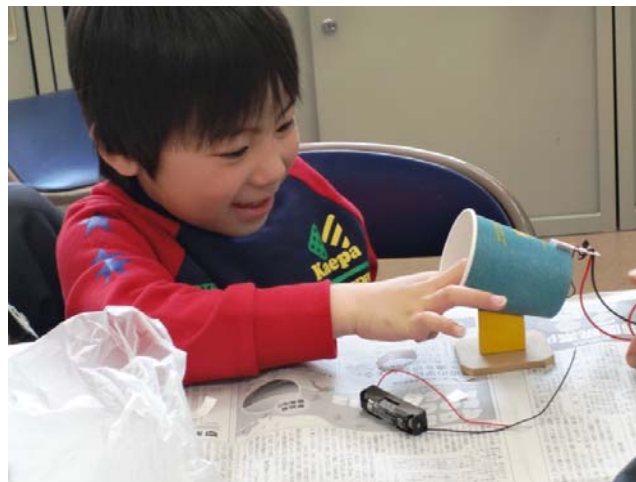
オルゴールが鳴った！！