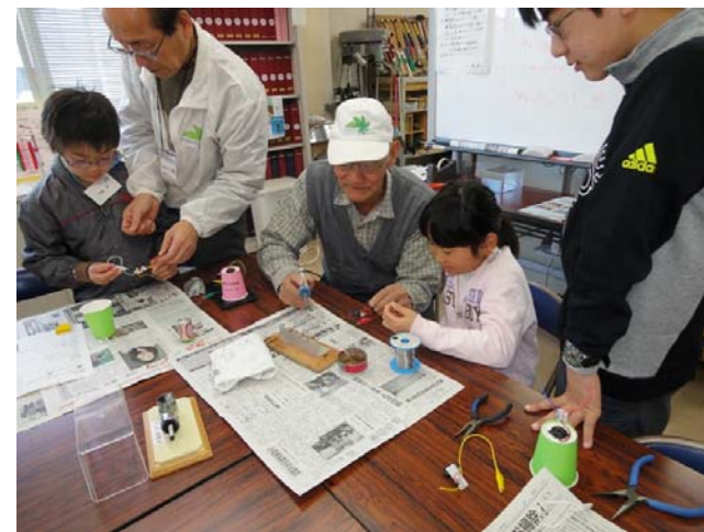
オルゴール配線ハンダづけ