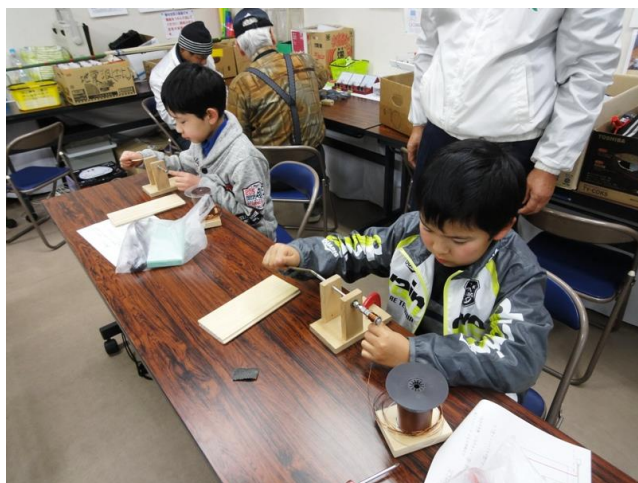
巻線機でコイルづくり