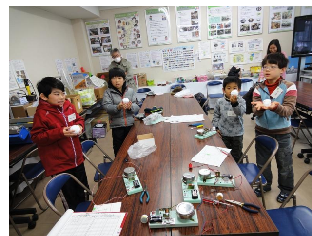
大きな音でベルが鳴り喜ぶ