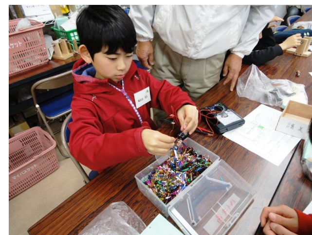
電磁石が完成できた