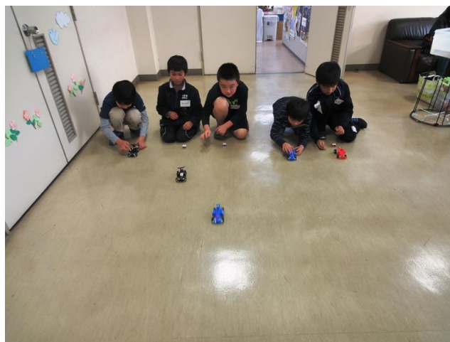
LED点灯で充電を確認しスピード競争