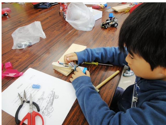
配線し充電チェック