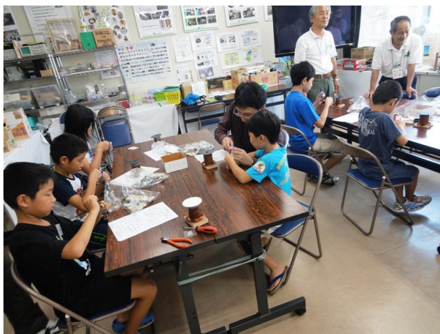
巻線し電磁石のコイルづくり

固定子側に電磁石、回転子側に永久磁石を組み込んだ電磁石エンジンづくり。 改良型のハイパワー電磁石エンジンで完成品に歓声！！