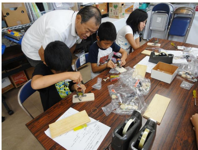
回転子側ローター組み込み