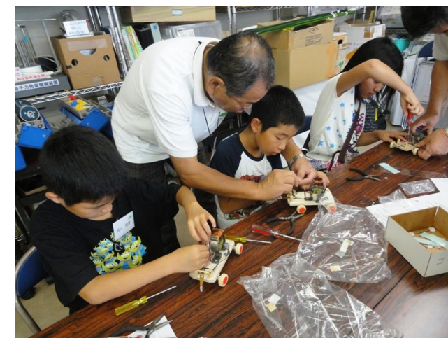
ハイパワー電磁石エンジン完成