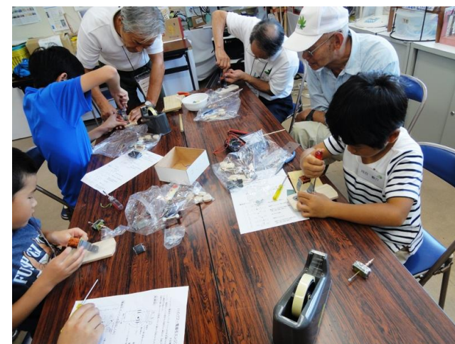
固定子側電磁石組み込み