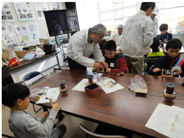
ドライブコイル巻線

永久磁石のコマとケースの内に組み込んだ電磁石のはたらきで回るコマづくり。 ドライブコイルの巻線や電子回路の組立など上手に完成させ回るコマに感動！！