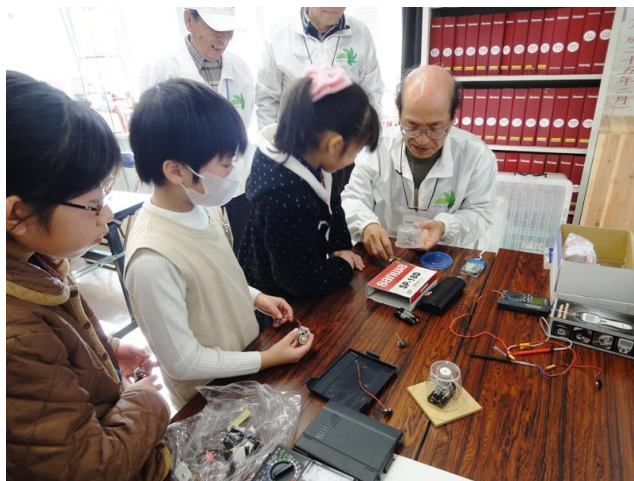
電子回路チェック