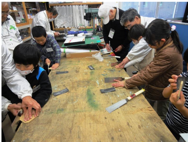
のこぎりでベース工作