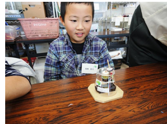
LED も点灯し回り続けるコマに感動！