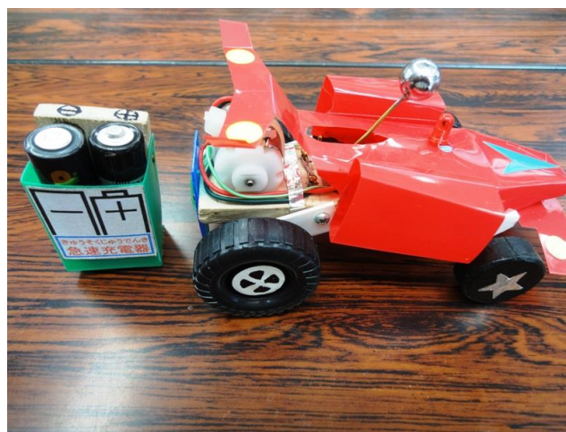
充電器と完成した電気自動車