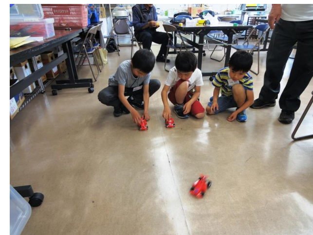
LED点灯で充電を確認しスピード競走