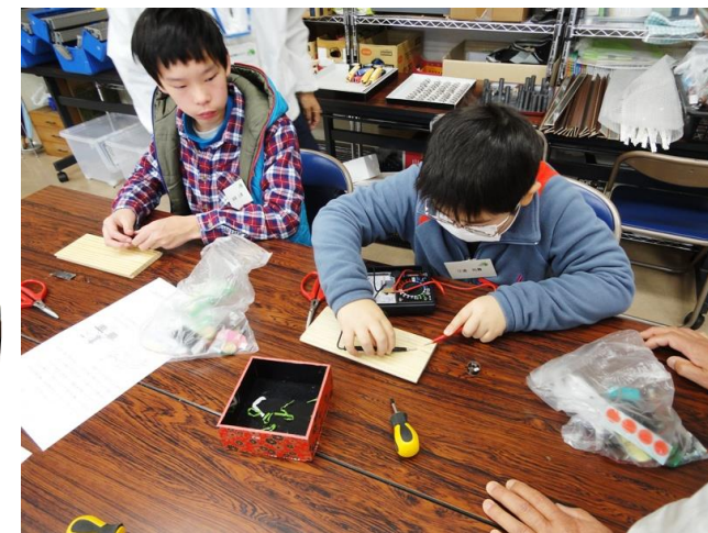
コイルに電気が流れるかテスターで確認