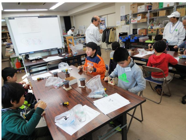
巻線し電磁石づくり

動力にリニアモーターを使いレールと車輪で走行する車輪式リニアモーターカーづくり。 車体に電磁石とブラシをのせ、レール側に永久磁石と電極を取りつける。