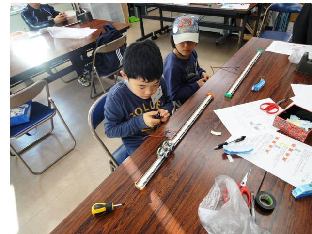
見事に完成！ 速さに感動！