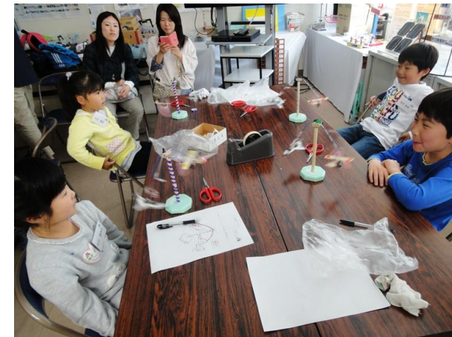
プロペラが回転し飛行機が飛んだ！！