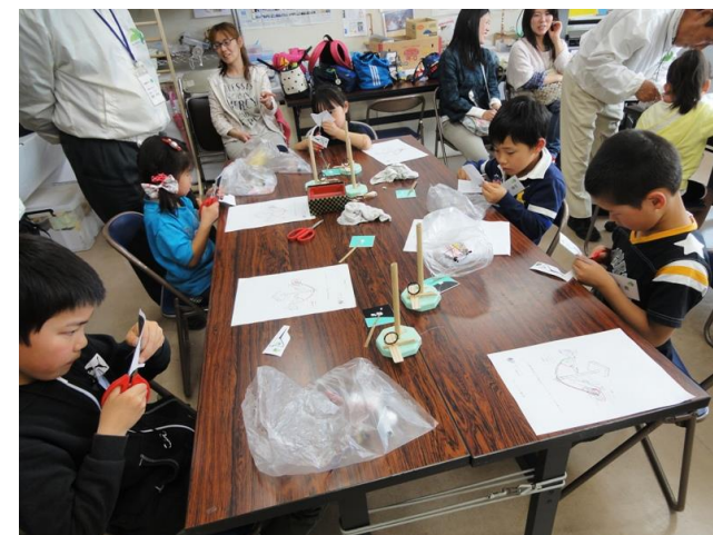
ハサミを上手に使ってスペースシャトルづくり