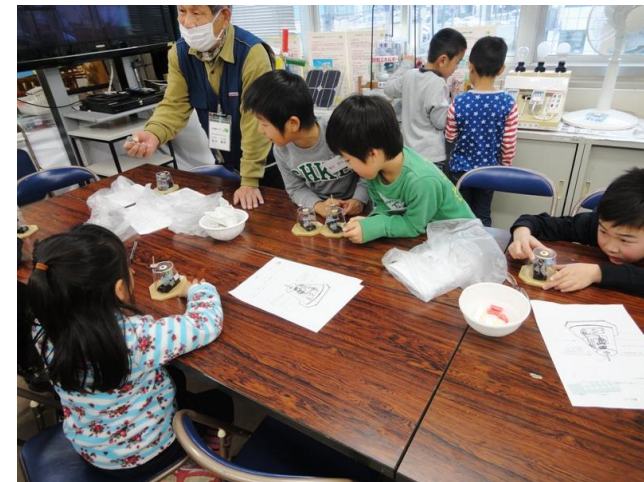
回り続けるコマに感動！！