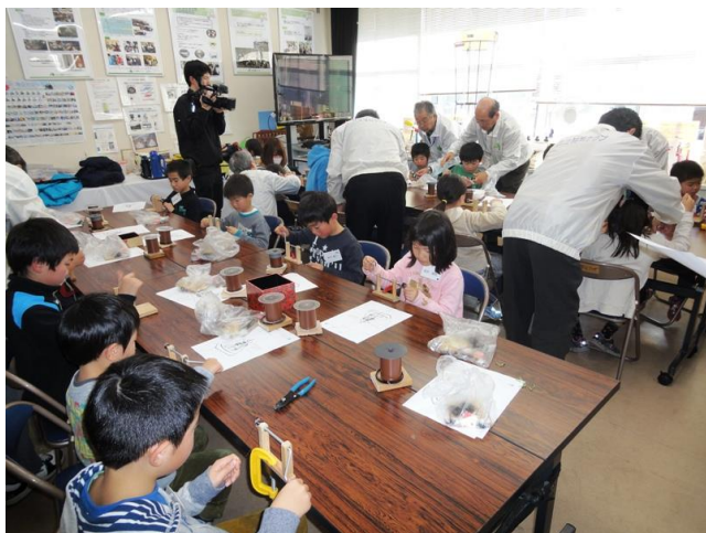
巻線作業 (JWAY 取材)

永久磁石のコマとケースに組み込んだ電磁石の働きで回るコマづくり。 コイルの巻線や電子回路の製作など上手に完成させ回るコマに感動！！