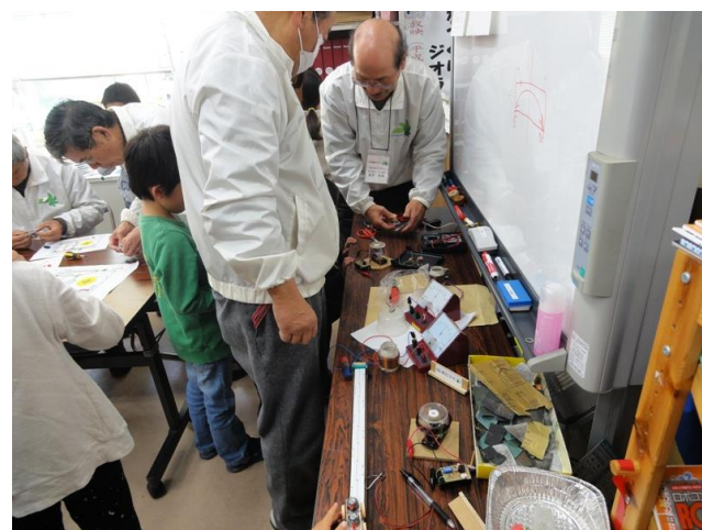
電子回路チェック