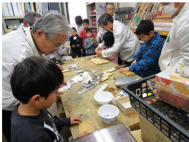
ノコギリでベース製作