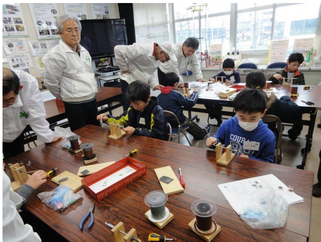
巻線し電磁石づくり

動力にリニアモーターを使い、レールと車輪で走行する車輪式リニアモーターカーづくり。 車体に電磁石とブラシをのせ、レール側に永久磁石と電極を取りつける。