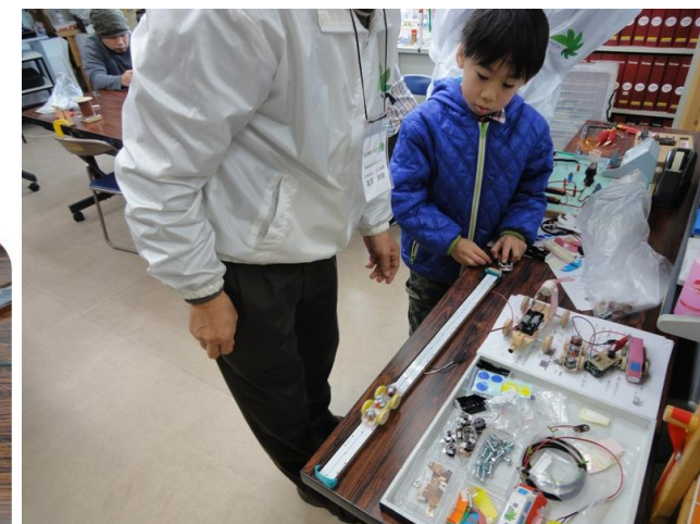
リニアモーターテスト合格