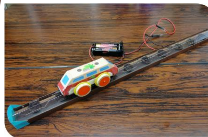
リニアモーターカー