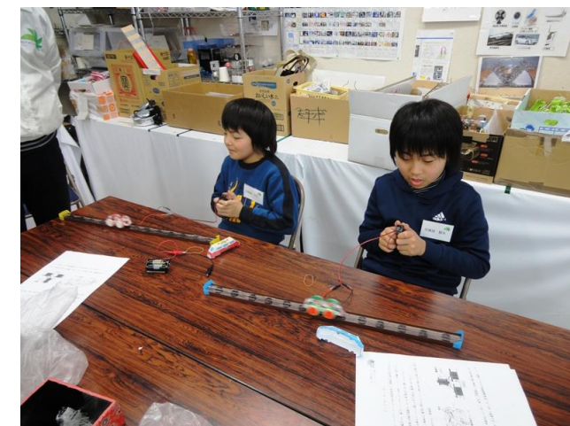
見事完成。速さにびっくり！！