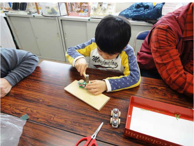
車体に車輪取付け