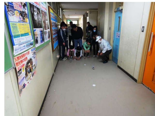
速さを競っています