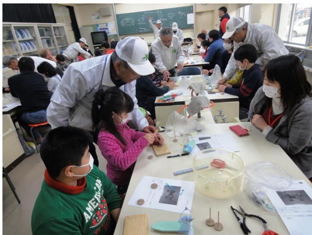
理科室での工作風景

秋山小父親委員会主催の工作教室に参画。 電池でモーターを回し、プロペラを回転させて走るプロペラカーづくり。