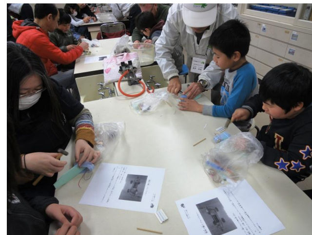
モーターを車体に取り付ける作業