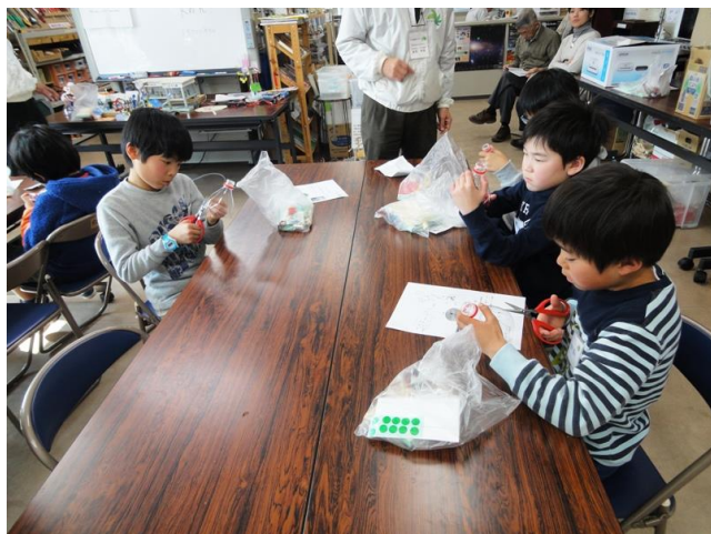
ペットボトルで羽根づくり

ペットボトルで風車をつくり、うちわの風で発電機を回し明りを灯す。 全員上手に完成でき、LEDに明りが灯ると歓声があがる。