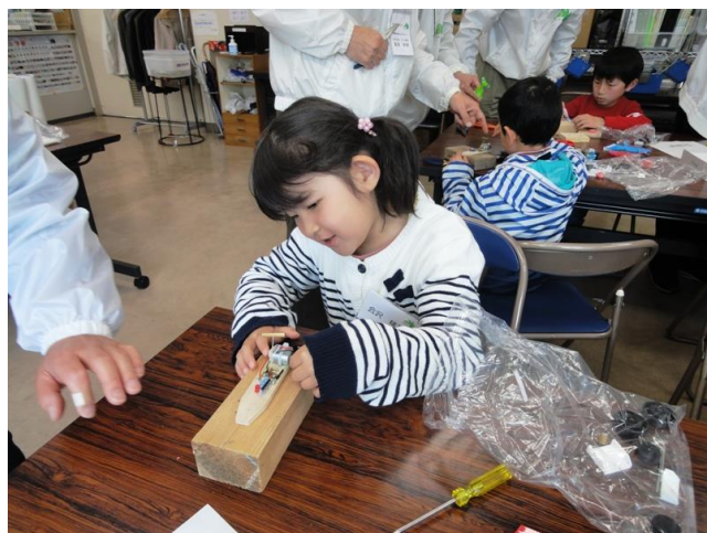
配線し、充電チェック（モーター回転）