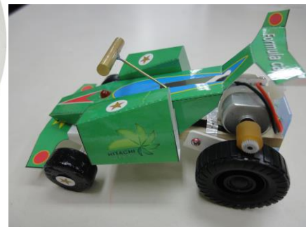
完成した電気自動車