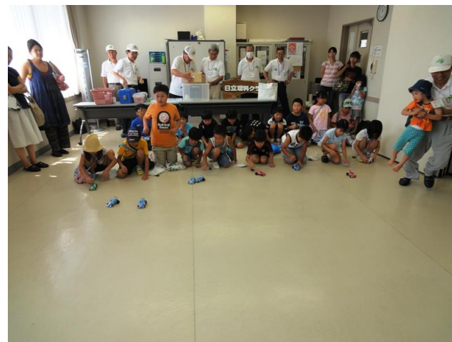
電池で充電し電気自動車を走らせる