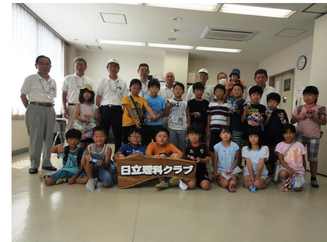
参加者と理科クラブの指導者