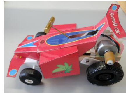
完成した電気自動車