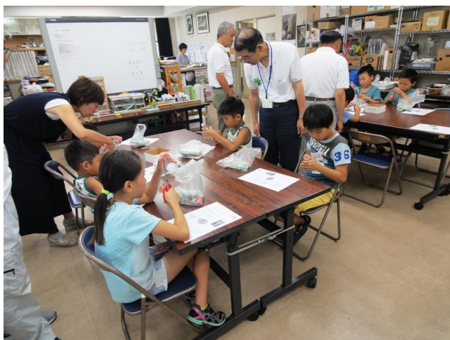
ハサミを使ってペットボトルで風車づくり

ペットボトルで風車をつくり、うちわの風で発電機を回し明かりを灯す。 全員上手に完成でき、LEDに明りが灯ると歓声があがる！！