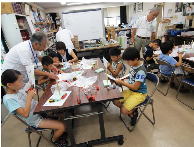
ハサミを使い家づくり