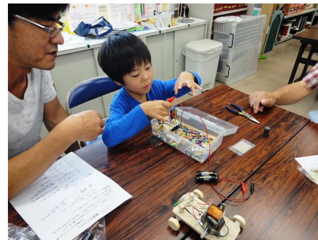
コイルが電磁石となった実験