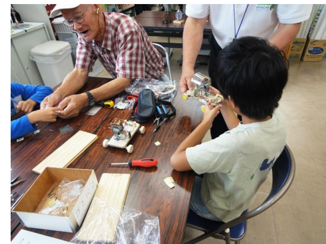
回転確認し完成を喜ぶ