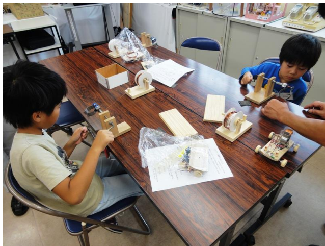
巻線し電磁石のコイルづくり

固定子側に電磁石、回転子側に永久磁石を組み込んだ電磁石エンジンづくり。 改良型のハイパワー電磁石エンジンで走る車に歓声！！