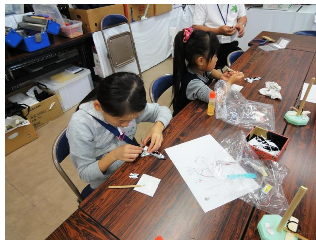
スペースシャトルに電池を入れ完成