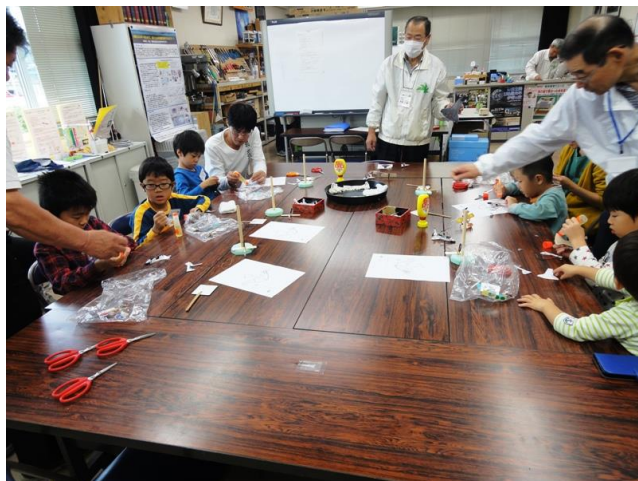
接着剤（ボンド）を使って飛行機づくり

磁石回転のモーターをつくり、プロペラを回転させた飛行機タワーづくり。 全員が上手に完成でき、テールランプが点灯し飛ぶ飛行機タワーに感動！！