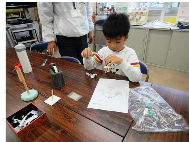
プロペラが回転した！！