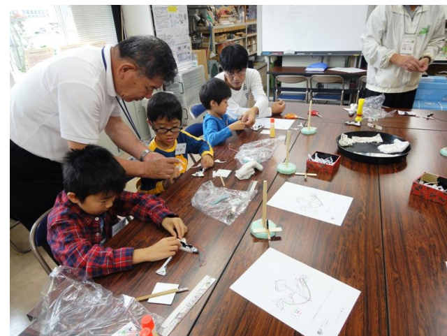
電池を入れるスペースシャトルづくり