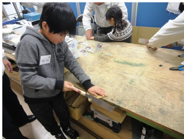
ノコギリでベース製作