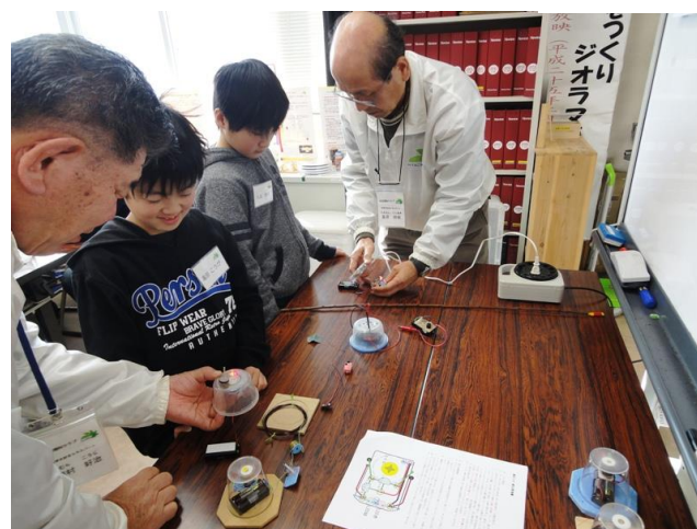
電子回路チェック