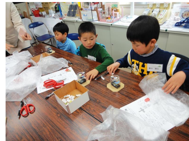
回り続けるコマに歓声！！