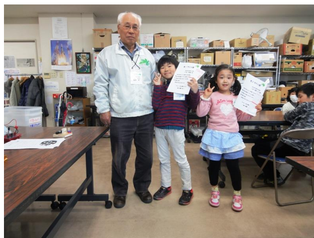
28年度モノづくり表彰（4名）