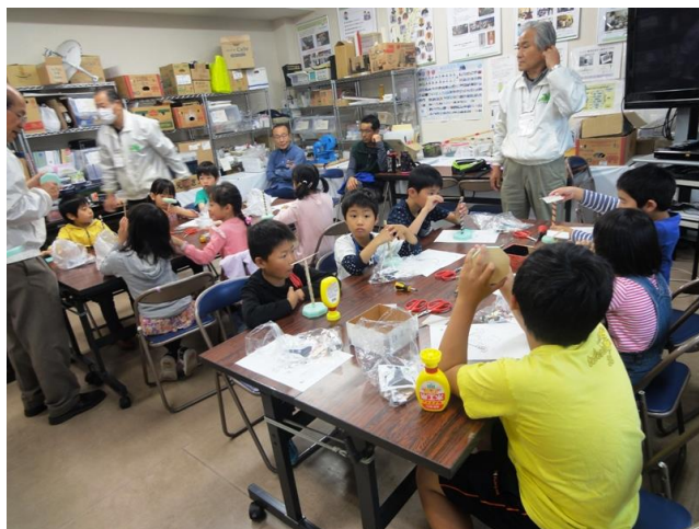
タワースタンド組立

磁石回転型のモーターをつくり、プロペラを回転させた飛行機タワーづくり。 全員上手に完成でき、テールランプが点灯し飛ぶ飛行機タワーに感動！！