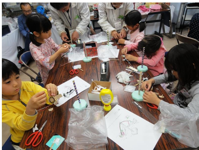
飛行機にモーターを取付け