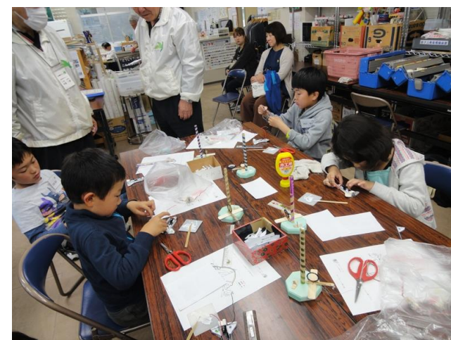
電池を入れるスペースシャトルづくり