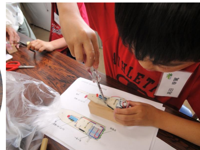
コンデンサを取り付け配線作業