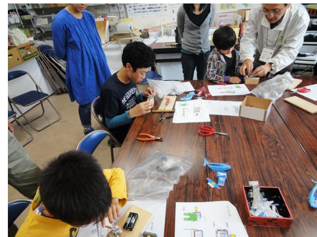
配線チェックしモーター回転確認