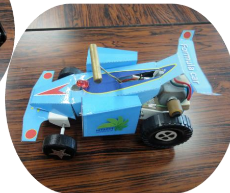
完成した電気自動車