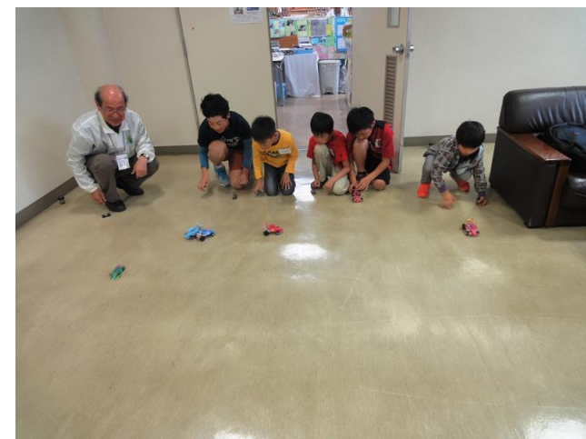
スピード競走、工作体験楽しかった