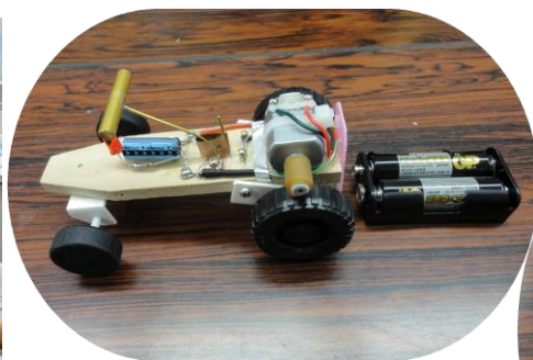
電気自動車と充電器