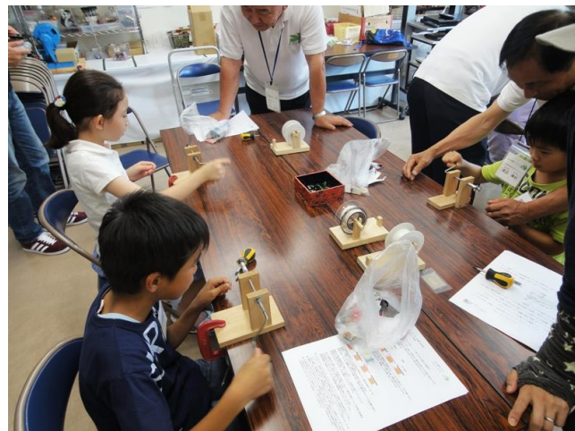
巻線し電磁石づくり

動力にリニアモーターを使用し、レールと車輪で走行する車輪式リニアモーターカーづくり。 車体に電磁石とブラシをのせ、レール側に永久磁石と電極を取りつける。