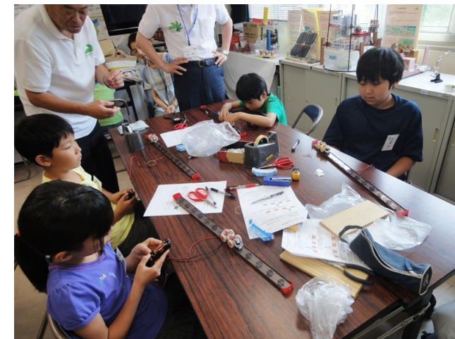
走行の速さにびっくり！楽しいモノづくり