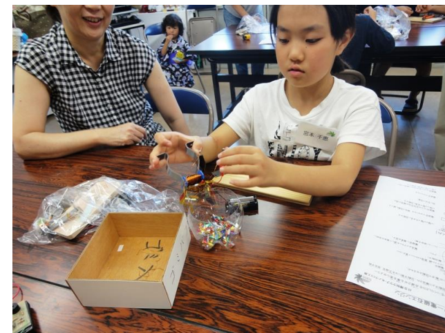
コイルに電気を通して電磁石ができた