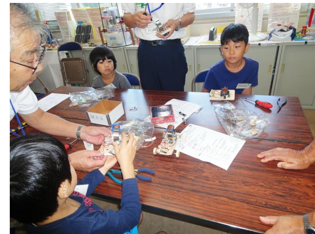
ハイパワー電磁石エンジン回った！！