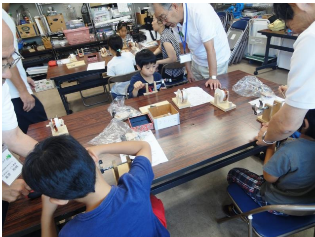
巻線機で電磁石コイルづくり

固定子側に電磁石、回転子側には永久磁石を組み込んだ電磁石エンジンづくり。 改良型のハイパワー電磁石エンジンで完成品に歓声！！