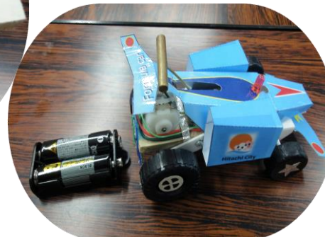
完成した電気自動車と充電器