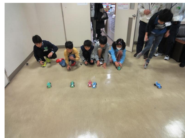
スピード競走。工作体験楽しかった！