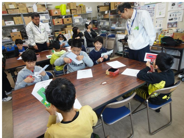
ハサミを使いボディづくり