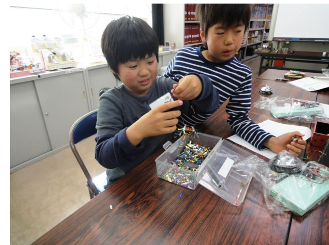
コイルに電気を流し電磁石ができた