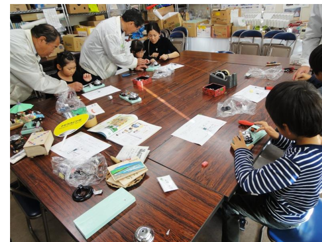
ベルが鳴り楽しかった