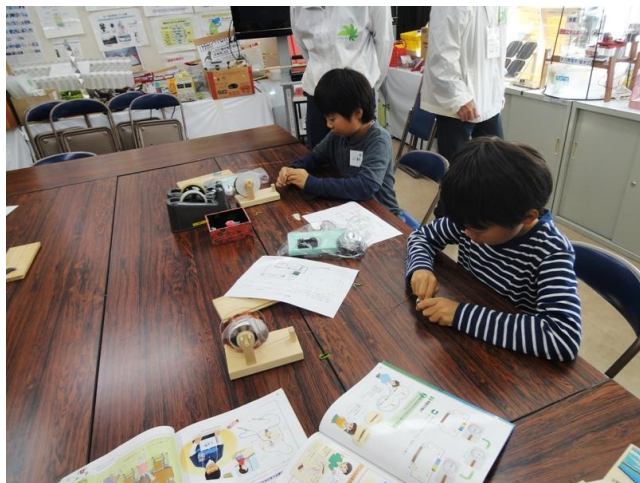
ボルトにエナメル線を巻きコイルづくり