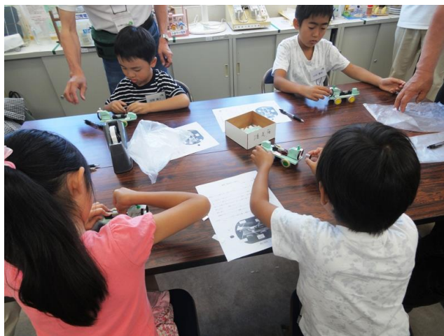
電磁石を近づけると走った