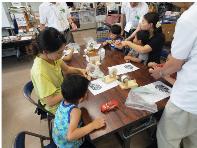
竹製の雇いでコイルづくり

乾電池に接続したコイルに永久磁石を近づけると走る電磁力推進車づくり。 永久磁石を近づけると力が発生し走る車づくり楽しかった！！