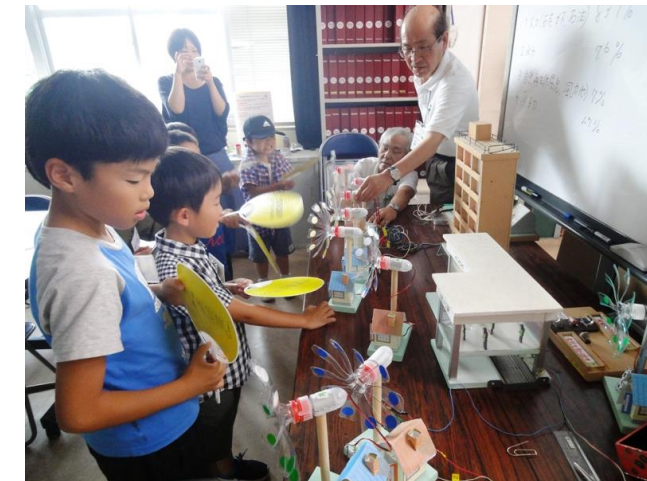
マンション・駅舎のジオラマに明かりが灯った