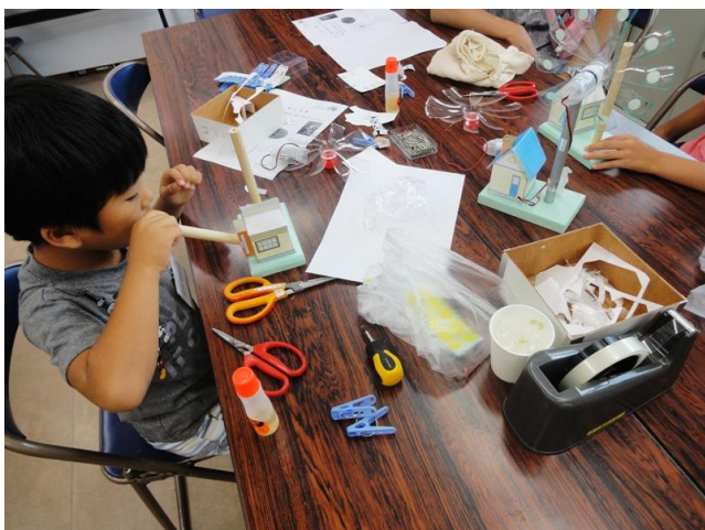
発電機・風車取付け用柱の組立