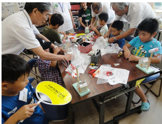
配線し風車を回すと発電した