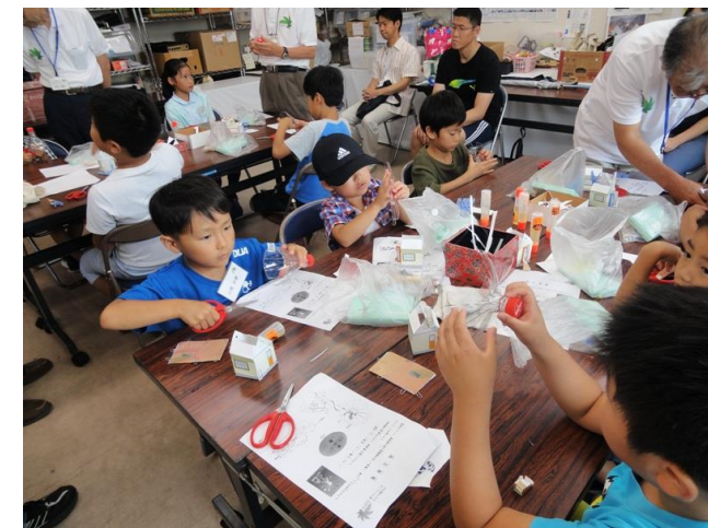
ハサミを使ってペットボトルで風車づくり