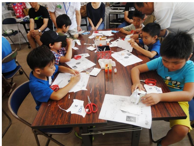
画用紙をハサミで切り糊で家づくり

ペットボトルで風車をつくり、うちわの風力で発電機を回し明かりを灯す。 上手に完成できマンションや駅舎のジオラマに明かりが灯ると歓声！！